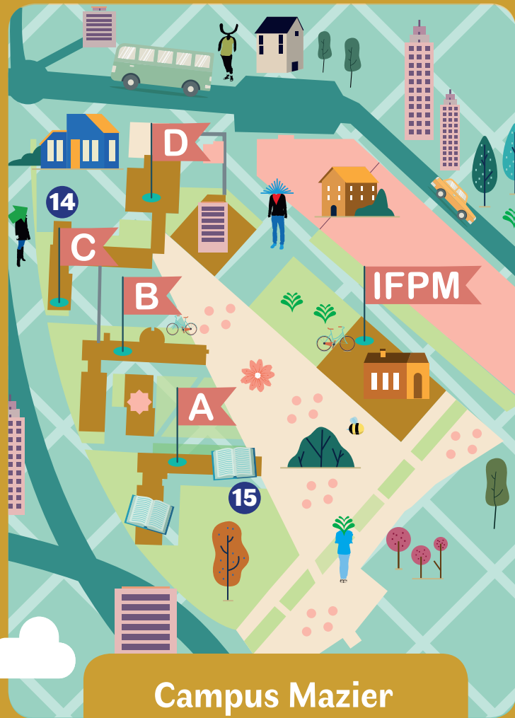
Campus Mazier (Saint-Briec)