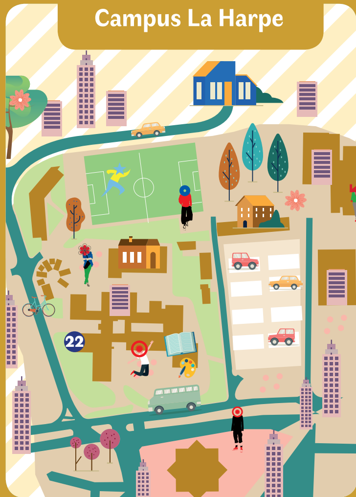
Campus La Harpe