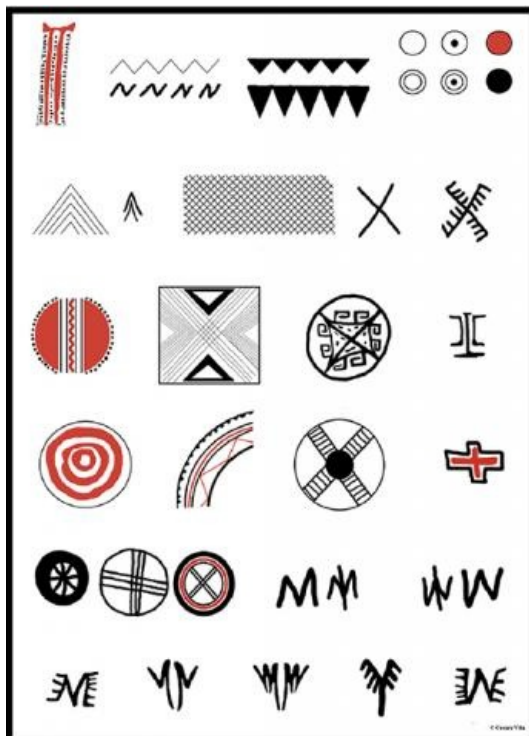
Zone archéologique du projet SandMan

En général, les études se sont toujours concentrées sur les objets grecs (ou grecs-coloniaux) présents dans les contextes indigènes, reléguant l'étude des céramiques indigènes à une position secondaire. Cette recherche, au contraire, utilisant une approche postcoloniale, déplacera la perspective sur la culture matérielle indigène, pour la compréhension de certaines dynamiques bidirectionnelles d'échange et d'acculturation entre les communautés locales et les « Autres ».